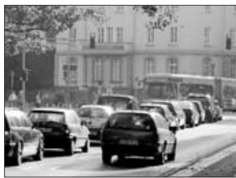
WARTEN AUF GRÜN: Die Ampelanlage am Emmichplatz kostet Nerven.

Ausschlaggebend ist die Vorrangschaltung der Stadtbahnlinie 10, die im Minutentakt über die Kreuzung fährt. Eine Passantin, die auf Grün wartet, legt die Strecke jeden Tag zurück.